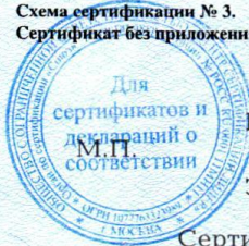
Схема сертификации № 3. Сертификат без приложения не действителен.