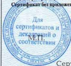
Схема сертификации № 3. Сертификат без приложения не действителен.