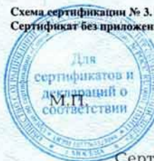
Схема сертификации № 3. Сертификат без приложения не действителен.