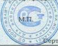
Схема сертификации: 1

Условия хранения продукции, срок хранения (службы, годности) указан в прилагаемой к продукции товаросопроводительной и/или эксплуатационной документации.