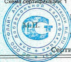
Схема сертификации: 1

Условия хранения продукции, срок хранения (службы, годности) указан в прилагаемой к продукции товаросопроводительной и/или эксплуатационной документации.